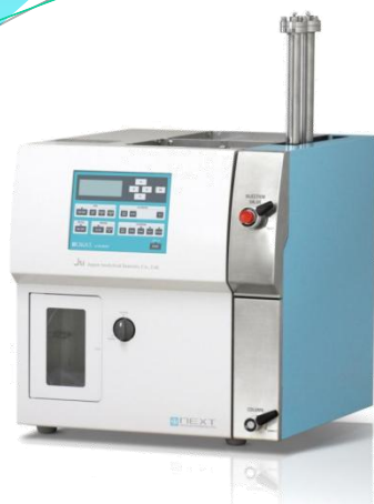
マニュアル専用 リサイクル分取HPLC LC-9210NEXT