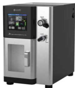
リサイクル分取HPLC LaboACE LC-5060