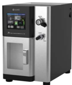
リサイクル分取HPLC LaboACE LC-5060