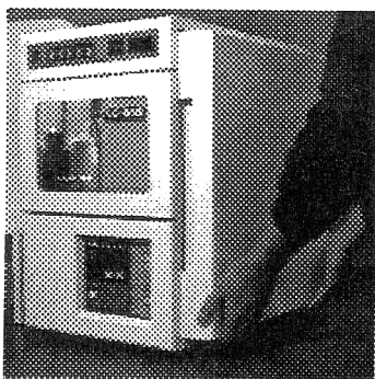
カラムカバーの外し方